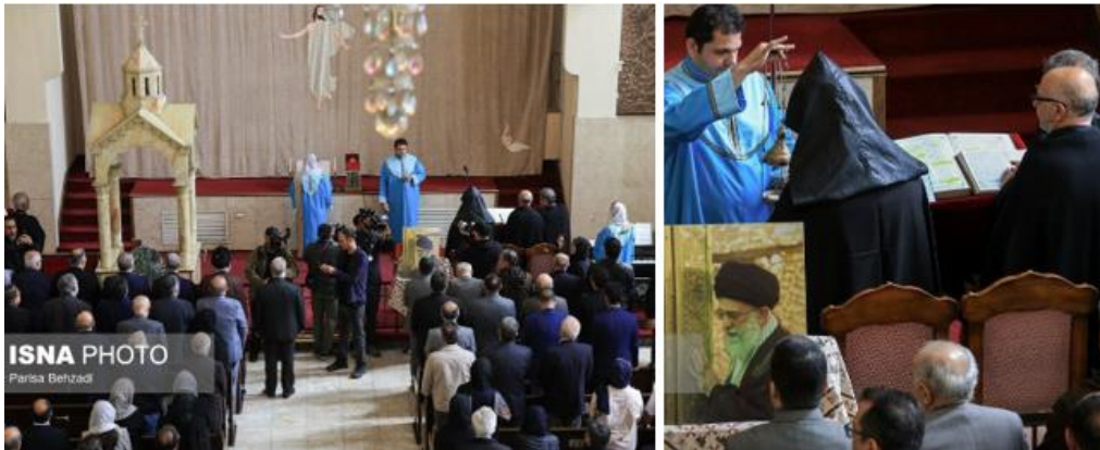
Service de la diplomatie publique Ambassade de la République islamique d'Iran – Paris